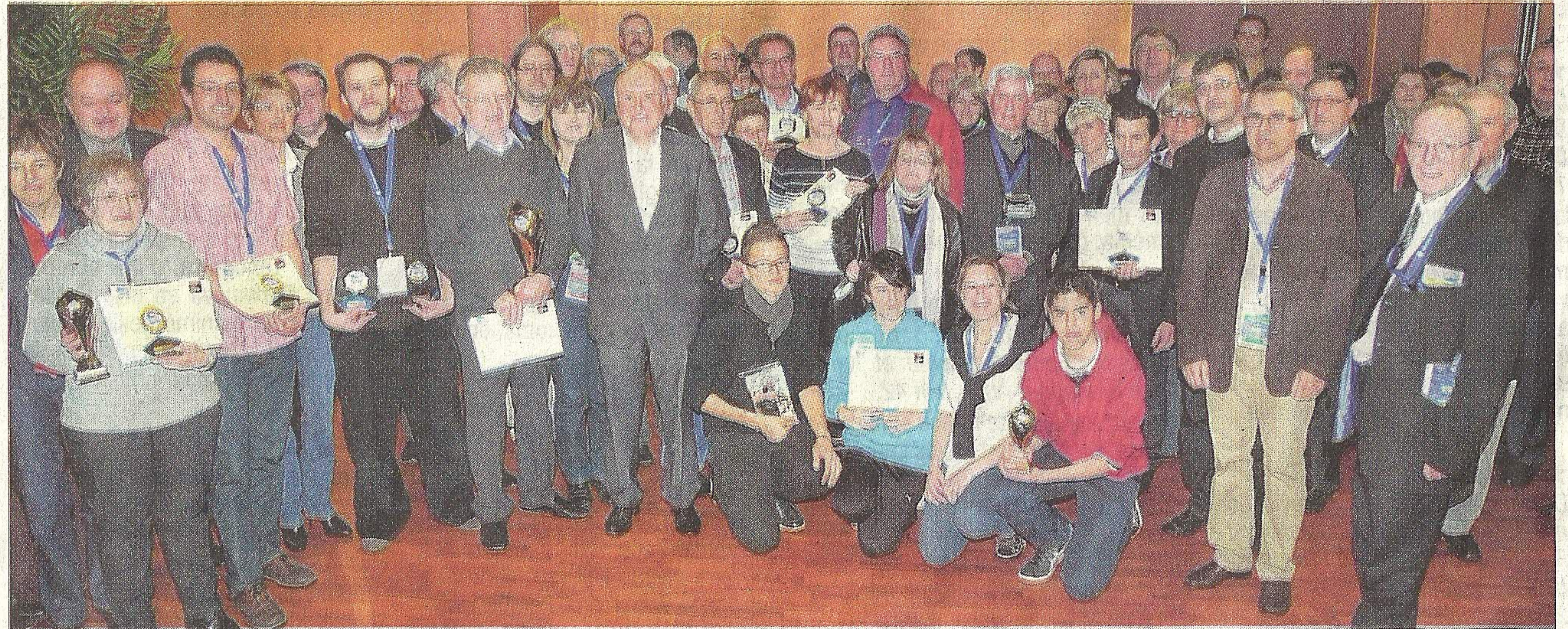
Les lauréats du concours de films vidéo très disputé. Le jury a mis longtemps pour départager les vainqueurs, signe que la qualité était au rendez-vous.

Il y a en effet 8 régions en France qui concourent chaque année. Les lauréats sont alors sélectionnés pour le concours national, qui se déroulera à Bourges en oc-